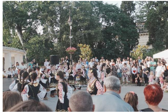
Varna Summer festival

parken, oude gebouwen, mooie natuur en de milder Zwarte Zee.