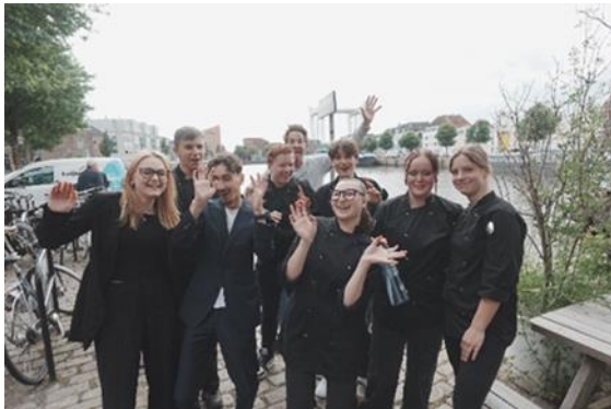
De Da Vinci studenten bij Merz

van Rebel Rebel, Merz en het Magazijn bereidden ze drie heerlijke maaltijden. Ongeveer 25 studenten van het 1e en 2e jaar werkten mee in de keuken en in de bediening. Voor de 2e-jaars was het een proefexamen. Daarvoor zijn ze allemaal glansrijk geslaagd.