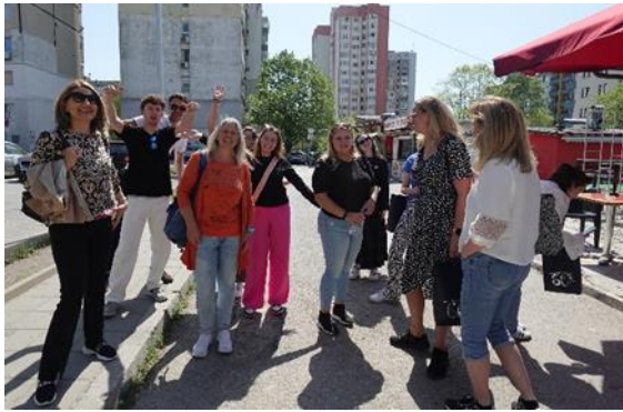
De Pabo-groep in Varna

Indrukwekkend vonden we de aandacht die aantal Bulgaarse scholen geven aan de emotionele beleving van de leerlingen. Op de "Iglicka kindergarden" kregen we les in een door de school zelf ontwikkelde methode die gebruikt wordt bij het voorkomen en het oplossen van conflicten tussen kinderen. De kinderen bespreken het conflict en leren de methode toe te passen om herhaling te voorkomen.