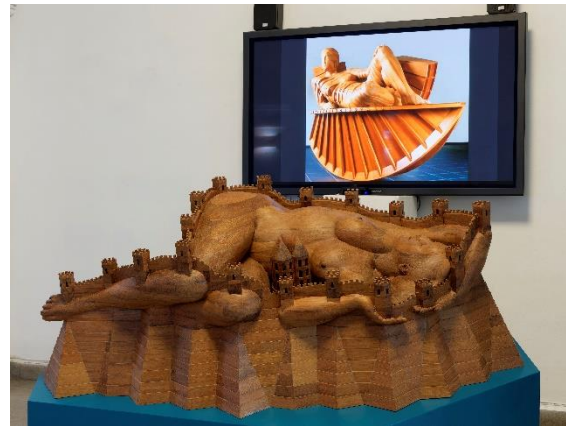
Gerhard Lentink, Opus 43: Hortus Conclusus

Vier dagen Varna met 6 Dordtse kunstenaars en met Ton Delemarre was een unieke ervaring met een bijzondere dynamiek. Zo duurde de rondleiding door het archeologisch museum bijna twee keer zo lang als gepland, maar dat vond de gids geen probleem, omdat hij zelden zo'n geïnteresseerd en geïnformeerd publiek had gehad.