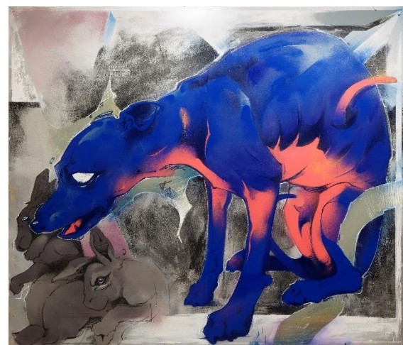
SIMIAN SWITCH, Panthera Tigris Tigris'