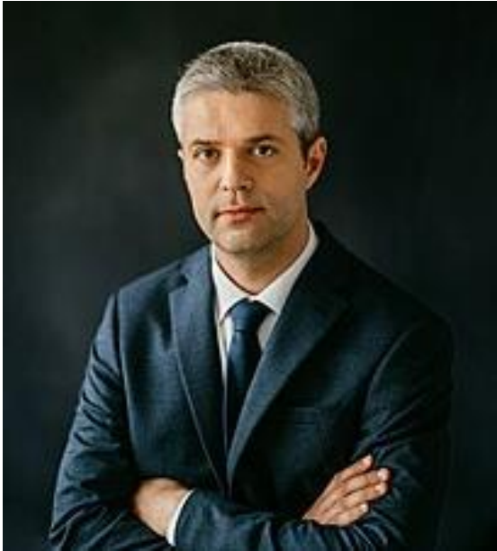
Blagomir Kotsev

Varna heeft na de verkiezingen van 5 november een nieuwe burgemeester: Blagomir Kotsev. In een 2 e verkiezingsronde werd de zittende burgemeester Ivan Portnyh verrassend, maar met duidelijke cijfers verslagen met 53 tegen 42%. Kotsev is van de nieuwe partij "We continue the change". Deze partij is ook in Sofia en in 2 andere grote steden de grootste partij. Daarmee is het een belangrijk politieke factor geworden. Zeker ook omdat de partij deel uitmaakt van de landelijke coalitie. Deze uit nood geboren samenwerking met GERB (de oude grote partij) heeft een wisselende premier en is voorlopig nog erg broos.