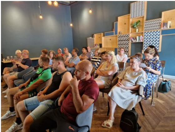
Aandachtig publiek tijdens de Bulgaarse dag